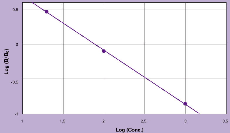
图二：灵敏型三聚氰胺检测试剂盒标准曲线

Melamine standards at 20, 100, and 500 ppb plotted as \text{logit}(B/B_0) vs. \text{log}(\text{concentration}) , r^2 = 0.999 . 50% inhibition = 124.2 ppb.